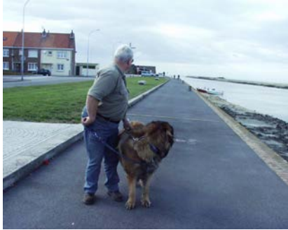
das ist am Loch Tummel