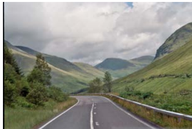
die kleine Millie in Craven Arms